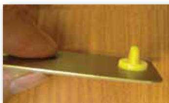
Retro con clip in plastica