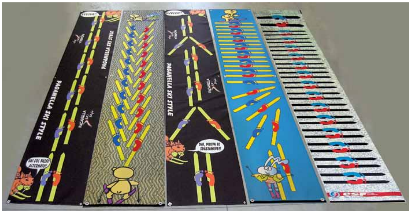
Esempi di tappeti con diversi esercizi e diversi colori di sfondo