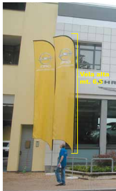
Esempio di bandiera da mt. 7,50