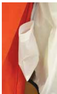
F- Taschina interna (cm 12x8) porta oggetti