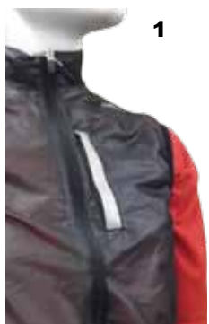
E- Taschino anteriore: 1-verticale con zip e catarifrangente 2-obliquo con zip