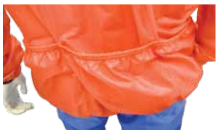
H- Retro con tascona divisa in 3 parti