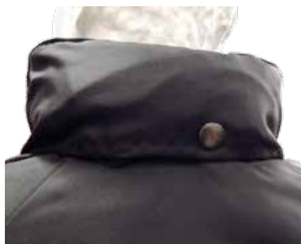
B- Cappuccio a scomparsa nel colletto con chiusura tramite clip