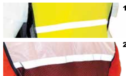
L- 1-Striscia catarifrangente anteriore 2-Striscia catarifrangente posteriore