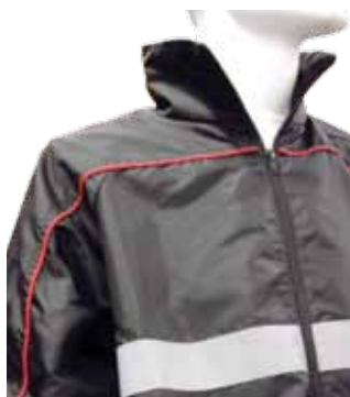
D- Coda di topo colorata anteriore (anche in catarifrangente)