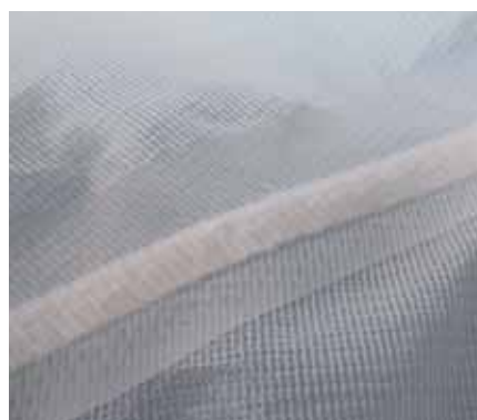
N- Cuciture nastrate