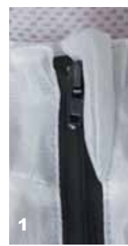
O- 1- Cerniera Antivento 2- Cerniera antivento con cursore a molla (che non sbatte)