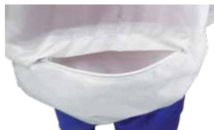
I- Retro con tascone (chiusura tramite zip) da cm 22x14