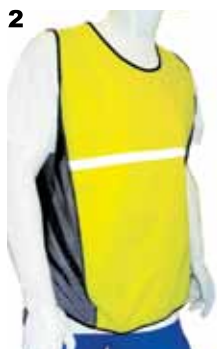
M- Colori a scelta per: -1 (1/A) girovita e (1/B) giromanica elasticizzati -2 sbieco non elastico sul perimetro