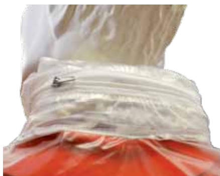
A- Cappuccio a scomparsa nel colletto con chiusura tramite zip