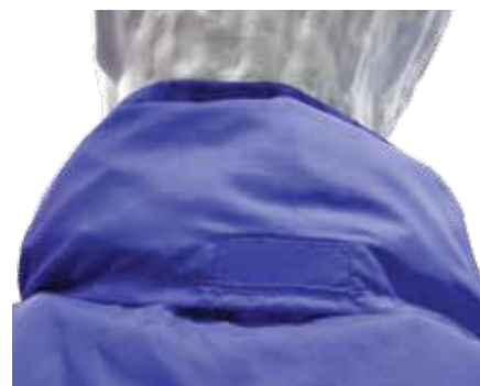
C- Cappuccio a scomparsa nel colletto con chiusura tramite velcro